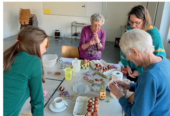
Ob beim Eierfärben (wo man sich wertvolle Tipps von erfahrenen «Färberinnen» holen kann) oder beim Zuhören einer Geschichte: Gemeinsam Erlebtes verbindet!