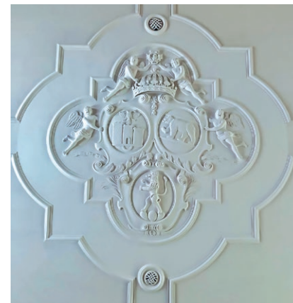
Medaillon in der Deutschen Kirche Murten