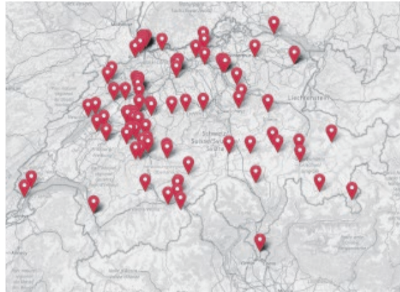
KARTE DER THEOLOGISCH BEDEUTSAMEN ORTE DER SCHWEIZ.

Manchmal weht etwas von dem alten Geist eines Ortes zu uns herüber und wir erahnen, wie viele Geschichten mit ihm verbunden sind. Ich liebe es, mir vorzustellen, wie z.B. Menschen des Mittelalters sich gefühlt haben, wenn sie eine Kirche mit prächtigem Bildwerk betreten